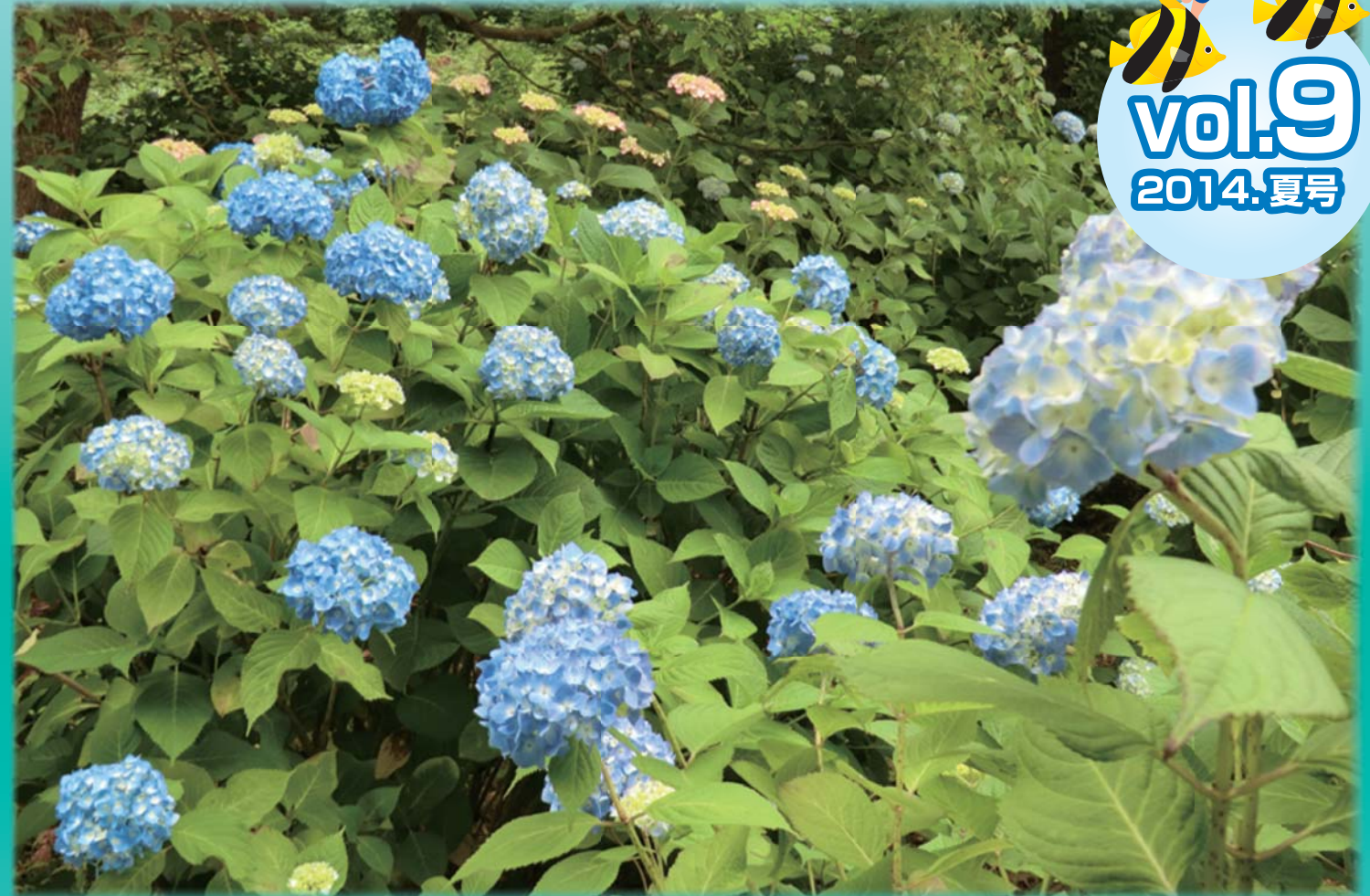
恋しの里あじさい園